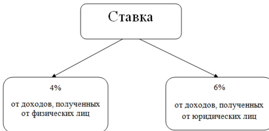
Рисунок 1 - Ставка налога на профессиональный доход

Ставка налога на профессиональный доход: