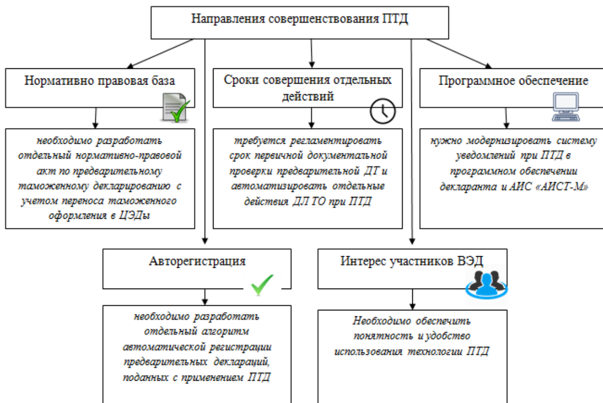
Рис. 3. Направления совершенствования предварительного таможенного декларирования

В соответствии с целью исследования можно сделать следующие выводы: